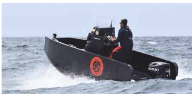
Le bateau Armen 500 en démonstration