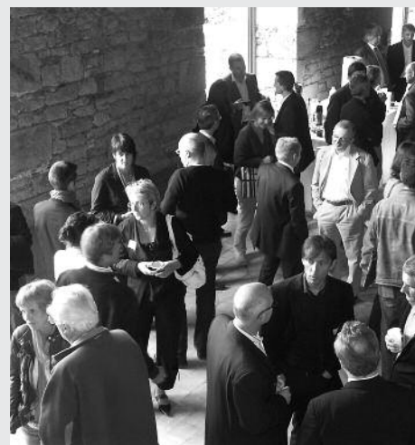
Journée thématique à Quimper pour les professionnels de l'emballage

Il est apparu clairement que la réduction du poids et/ou du volume d'emballage n'est que la partie émergée de l'iceberg. Les PME, grandes entreprises et laboratoires travaillent aussi sur les process, les décors, les flux, les déchets générés en interne..., etc.