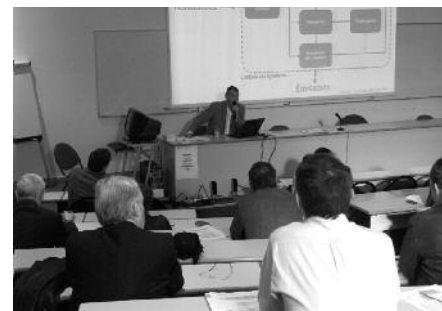
Assemblée des participants au PDD du 23 avril 2009, Quimper

MR : L'ensemble de ces démarches a permis de réduire les émissions mais également de réaliser des économies financières. Il nous faut continuer à avancer dans cette démarche et aller vers le développement durable. Le bilan carbone ne donne qu'une vision parcellaire de l'environnement, seulement il ouvre un autre regard pour « faire autrement » ; c'est un outil de management !