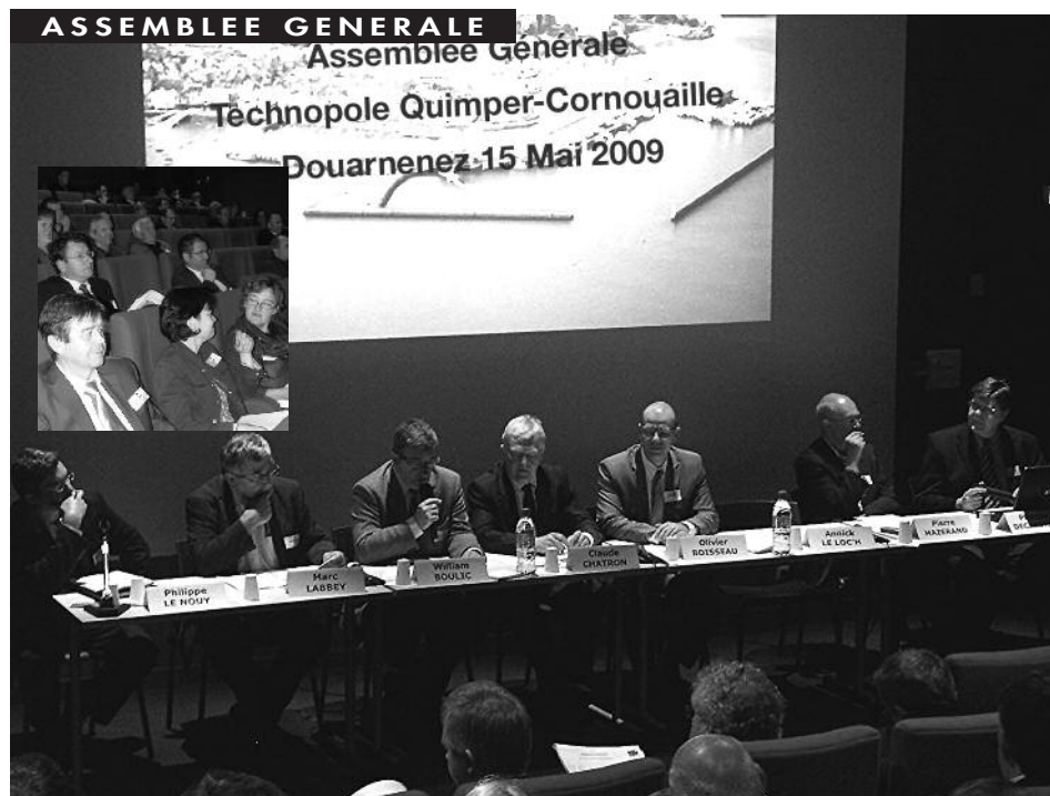
L'assemblée générale de la Technopole Quimper-Cornouaille s'est déroulée le 15 mai 2009 à la Médiathèque de Douarnenez